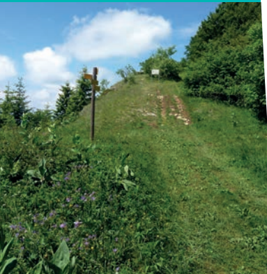
Chemin de crête vers l'Archelle. C.Maurel

After going down under the power lines, take the forest trail on your left. Yellow markers will guide you to the Saint-Michel pass from where you can go back to Aiguebelette on the Beauregard path and then on small country roads.